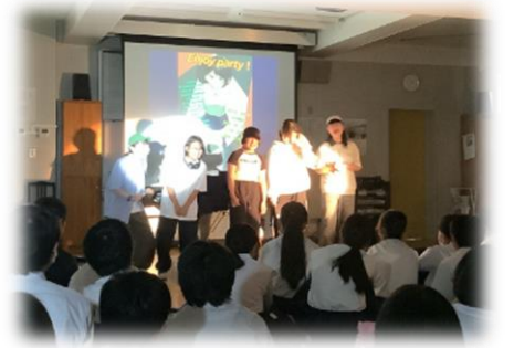
2年生が企画したイベント「Enjoy Party!」の様子